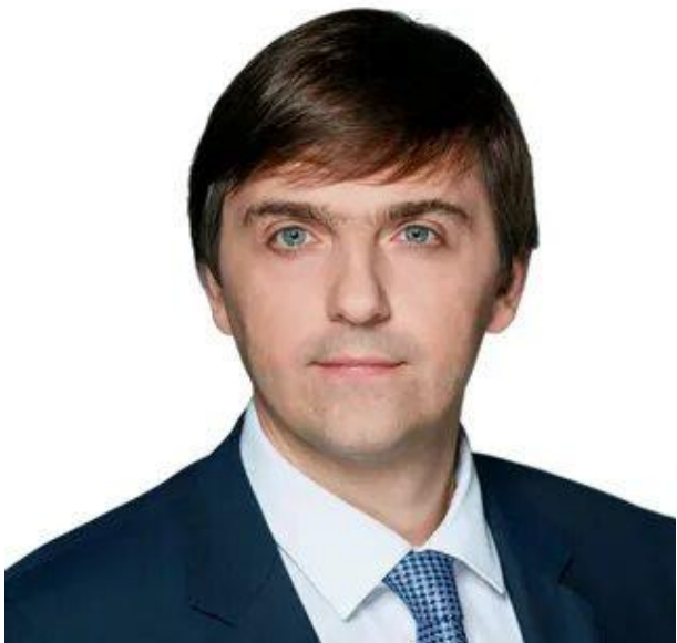
Кравцов Сергей Сергеевич, Министр просвещения Российской Федерации

«Подчеркну, что профориентация имеет колоссальный воспитательный потенциал. Благодаря профессионализму и активной позиции педагогов-навигаторов формируется интерес к выбору будущей профессии.