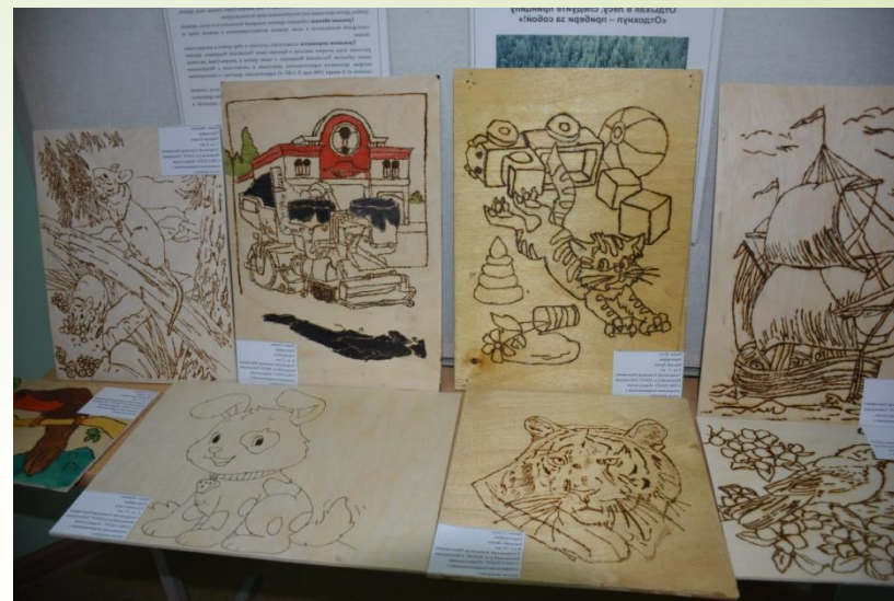
Работы детей на районной итоговой выставке «Творчество юных»