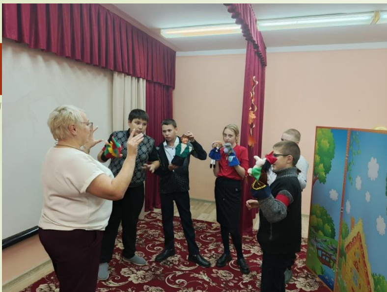
Мастер - класс