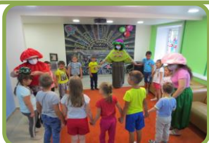
Словесно – музыкальные («Малика», «Тимербай»)