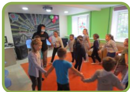
Хороводные («Тюбетейка», «Ручеёк»)