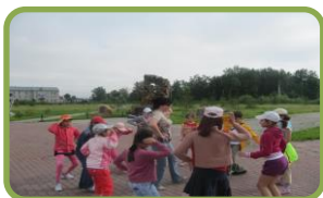
Музыкально-танцевальные («Апипа», «Пять пар»)