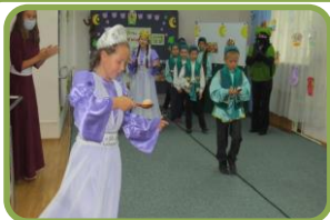
Подвижные (Игры Сабантуя, «Бег с яйцом», «Битье горшков»).