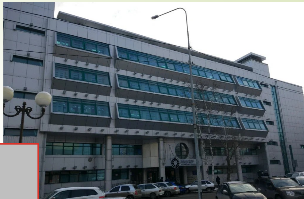
Тюменский колледж производственных и социальных технологий