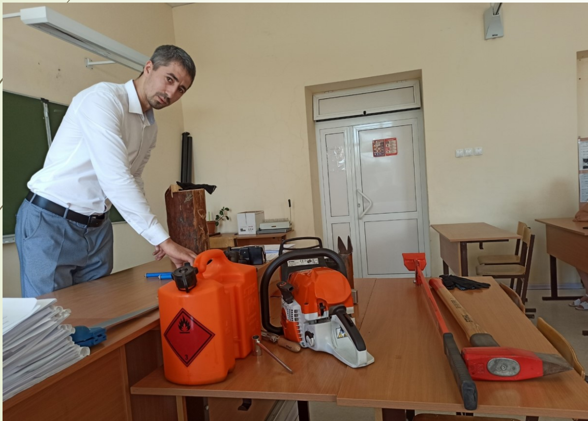
Мастер класс по использованию оборудования для специалистов лесного хозяйства