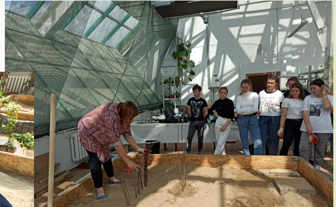
Мастер-класс по высадке кустарников и «живой изгороди»