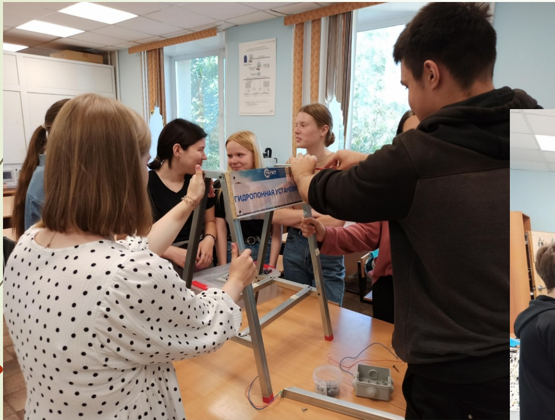
Сборка гидропонной установки в рамках занятий раздела «Сити-Фермерство»