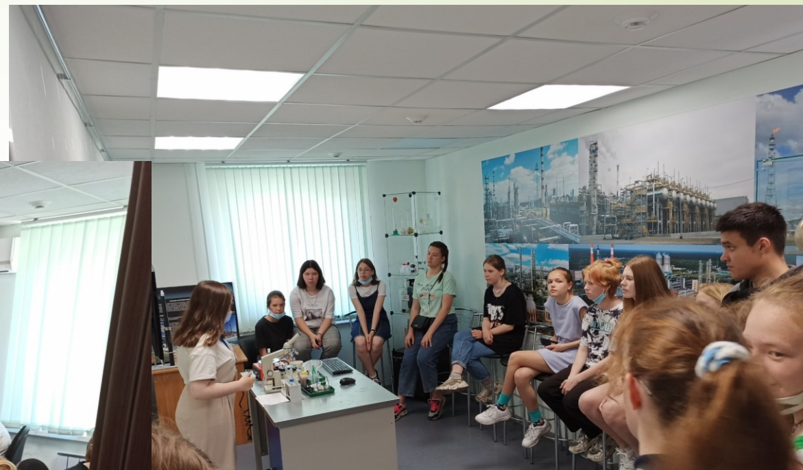
Экскурсия по модулю «Газовая и нефтяная промышленность» отдела Профориентации ЦЗН