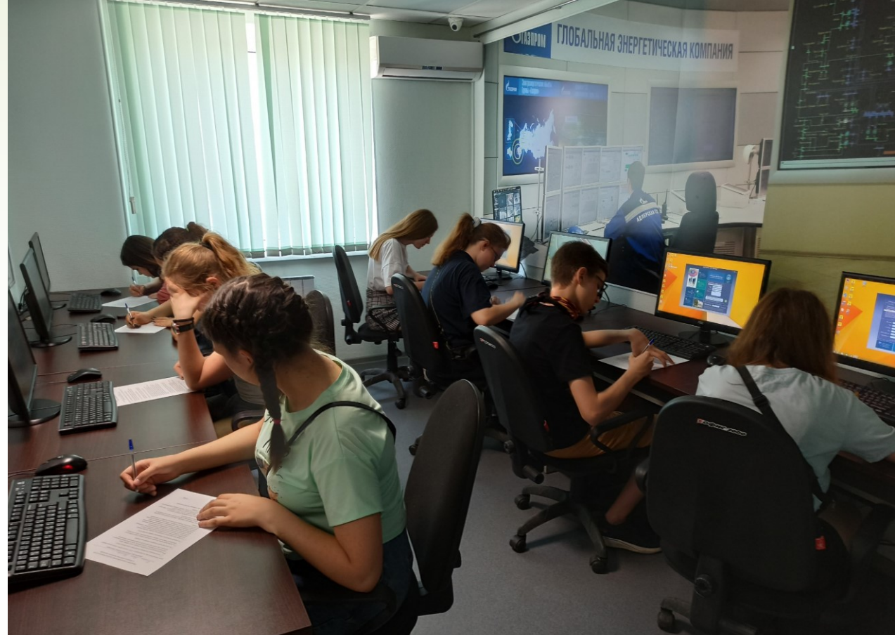
На фото процесс тестирования в ГЦЗН

Модульная дополнительная общеобразовательная общеразвивающая программа «ПУТЬ К ВЫБОРУ ПРОФЕССИИ» реализуется в рамках городского Проекта «Профориентир».