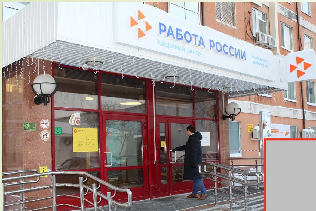
Центр занятости населения, г. Тюмень