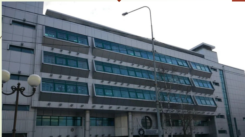
Тюменский колледж производственных и социальных технологий

В рамках договора о сотрудничестве с Тюменским колледжем производственных и социальных технологий на предмет проведения обучающих занятий, мастер-классов в производственных классах, на современном оборудовании по знакомству с востребованными на рынке труда профессиями в сфере сельского хозяйства: «Дизайнер ландшафтного проектирования», «Сити-Фермерство», «Лесное и лесопарковое хозяйство».