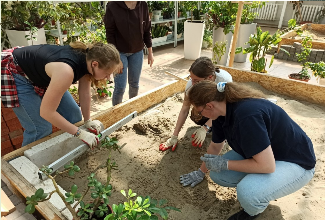
Мастер-класс по укладке тротуарной плитки