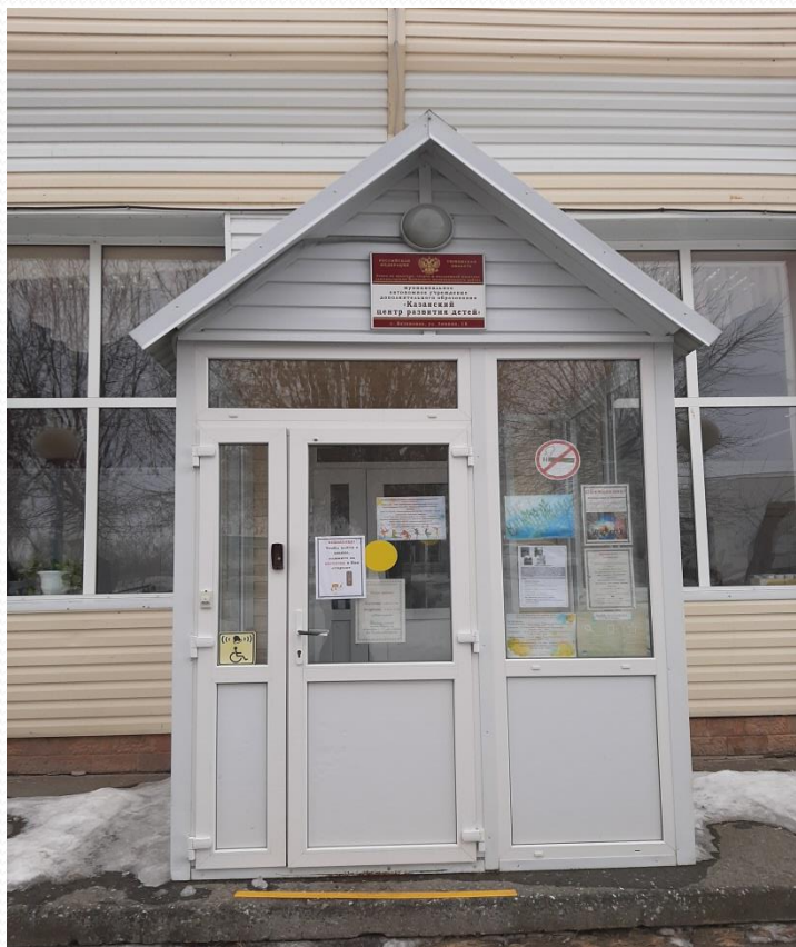
МАУ ДО «Казанский центр развития детей»