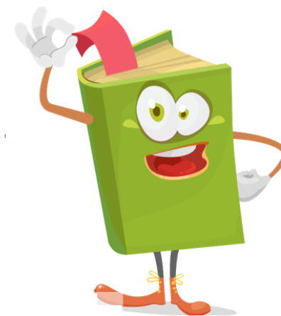
Электронная школа ТО