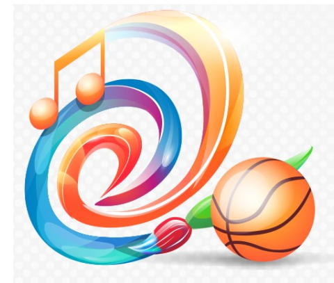
Электронное дополнительное образование