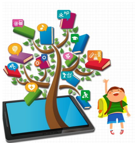
Региональная база талантливых детей и молодежи ТО