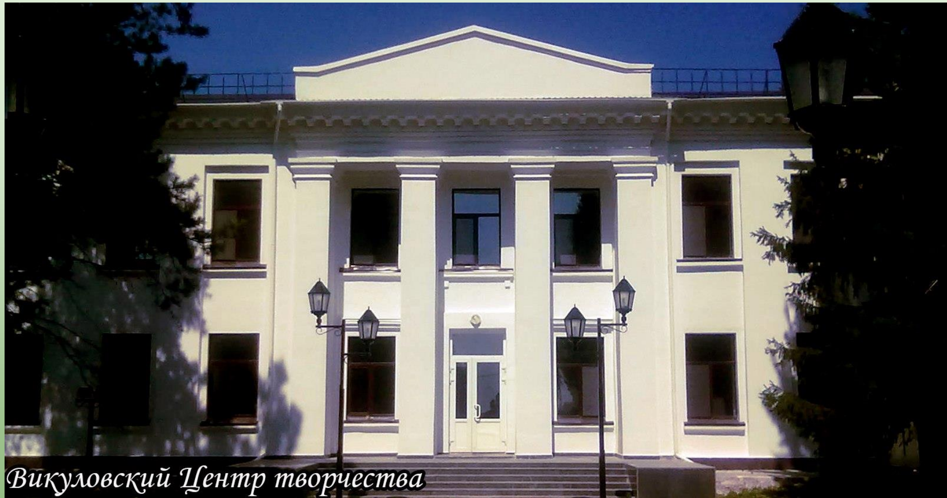
Викуловский Центр творчества