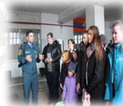
Главное управление МЧС №14 города Тюмени