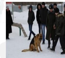
Войсковая часть 3059

для подростков СОП с участием наставников за год проводится от 80 до 120 мероприятий