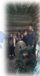
Галерея Оружие победы

за 2018 -19 гг. более 500 человек ознакомлено с проектом