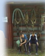
Музей «Сибирское подворье» п. Нижняя Тавда