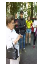
Экскурсии по Тюмени