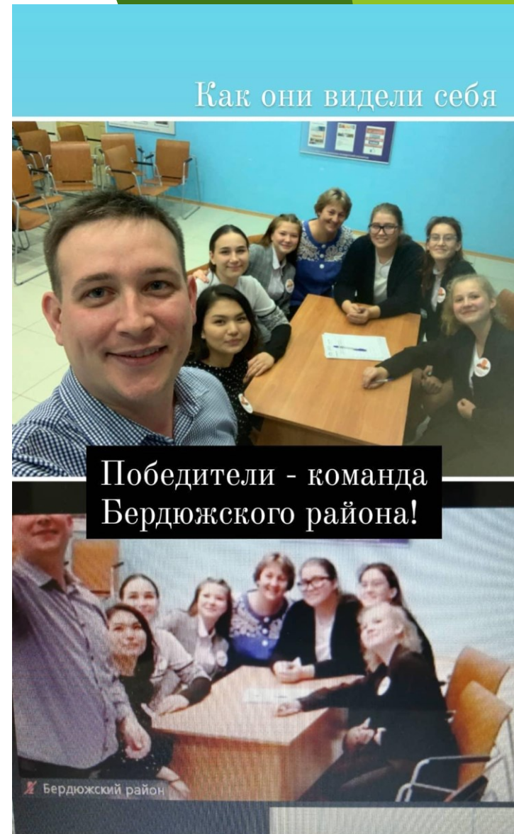
Как мы видели их)