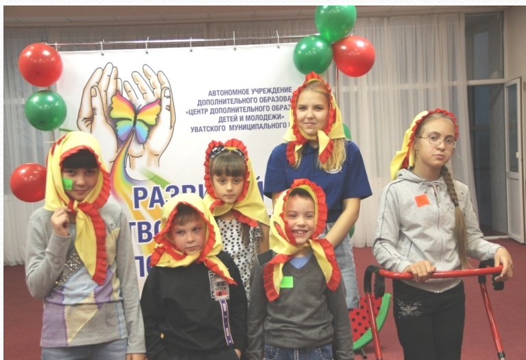
«Арбузник» посвящение в кружковцы