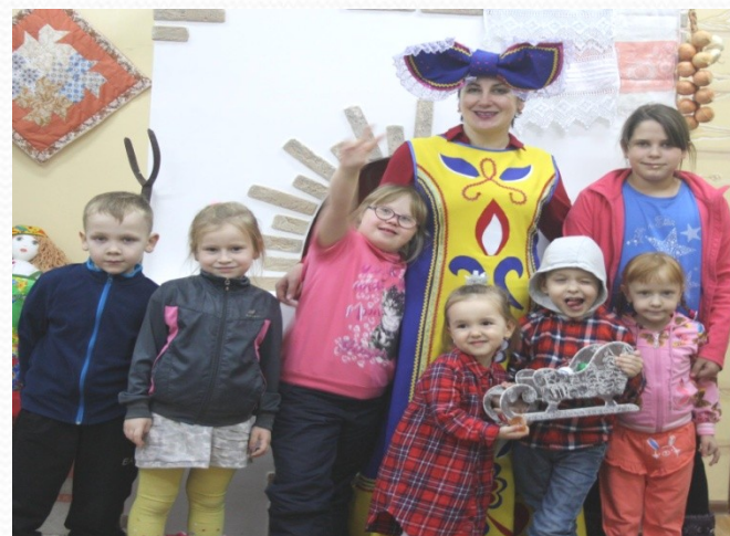
Клуб молодой семьи «Фрегат»