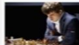
Чемпионы мира по шахматам