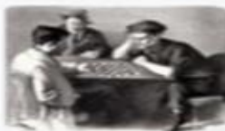
Шахматы в изобразительном искусстве