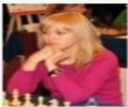
Чемпионки мира по шахматам