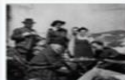
Известные люди любящие играть в шахматы