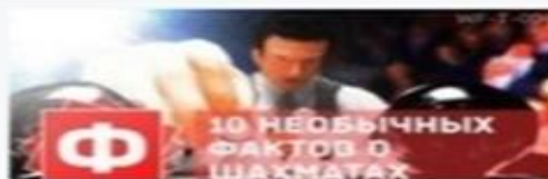
10 необычных фактов о шахматах