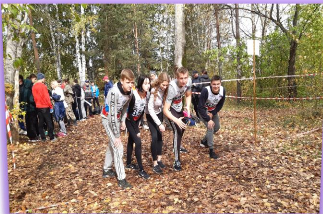
Соревнования по спортивному туризму