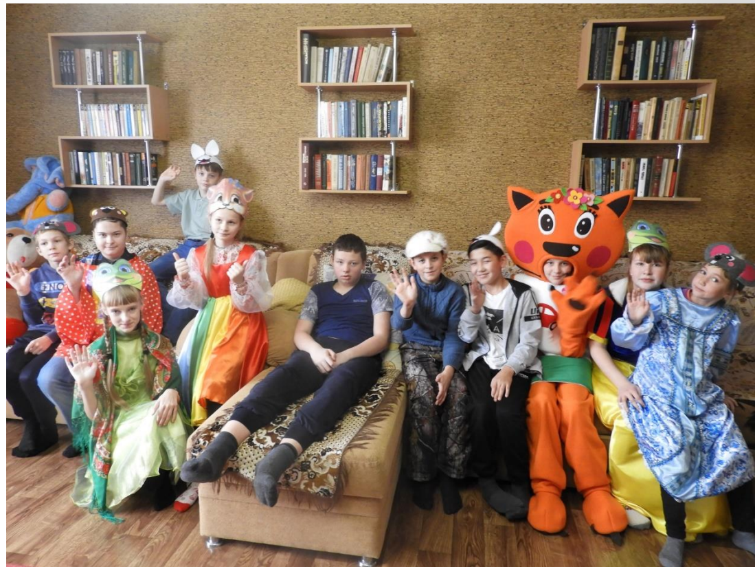
Ребята из объединения «Сказка на дом» в гостях у «особенного ребёнка»