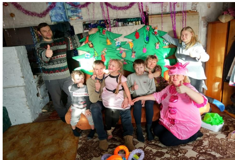
Выезды в детские сады, на дом к детям -инвалидам