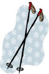
д) Лыжные палки